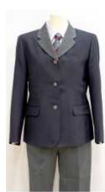
Bタイプ (スラックス)