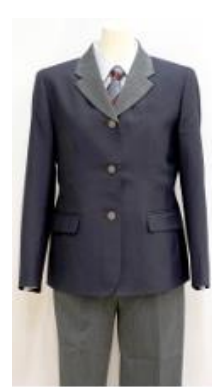
Bタイプ (スラックス)